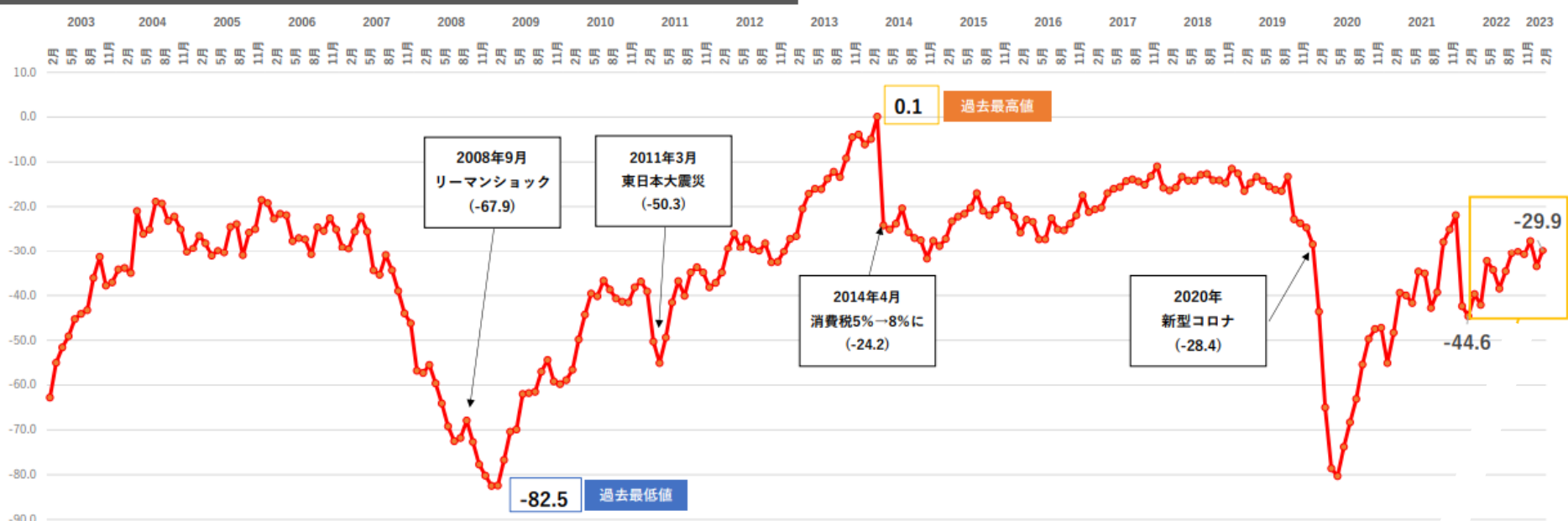
小規模企業景気動向調査 産業全体の業況DIグラフ～過去20年のトレンド～

なお、上記景況動向調査結果は、本会ホームページ ( https://ashiyashoko.com/ ) トップ画面に掲載した「小規模企業景気動向調査」バナー欄から、全国商工会連合会専用ページにアクセスいただき、最新の調査結果や、業種別の調査結果等、詳細情報もご確認いただけますので、ぜひご利用ください。