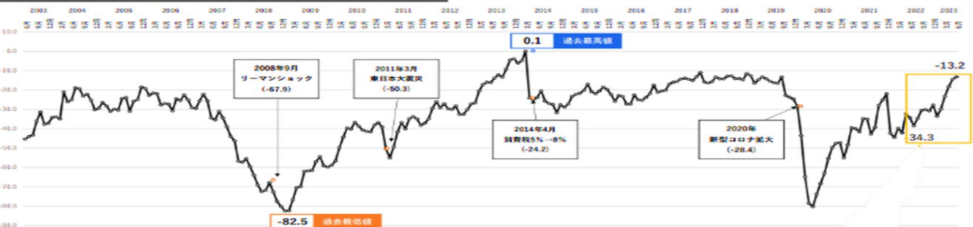
小規模企業景気動向調査 産業全体の業況DIグラフ～過去20年のトレンド～

なお、上記景況動向調査結果は、本会ホームページ ( https://ashiyashoko.com/ ) トップ画面に掲載した「小規模企業景気動向調査」バナー欄から、全国商工会連合会専用ページにアクセスいただき、最新の調査結果や、業種別の調査結果等、詳細情報もご確認いただけますので、ぜひご利用ください。