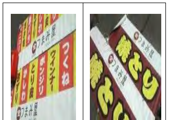
合計4種類の横断幕を作成

焼台を増やせたことで、課題であった ピーク時の生産量が飛躍的に増加 。従来は、ほとんど対応できなかった“まとめ買い”のお客様の注文にも応えられるようになったことで、 回転率の上昇と、機会ロス的大幅な減少に成功 。横断幕の効果と相まって売上のアップに繋げることができた。